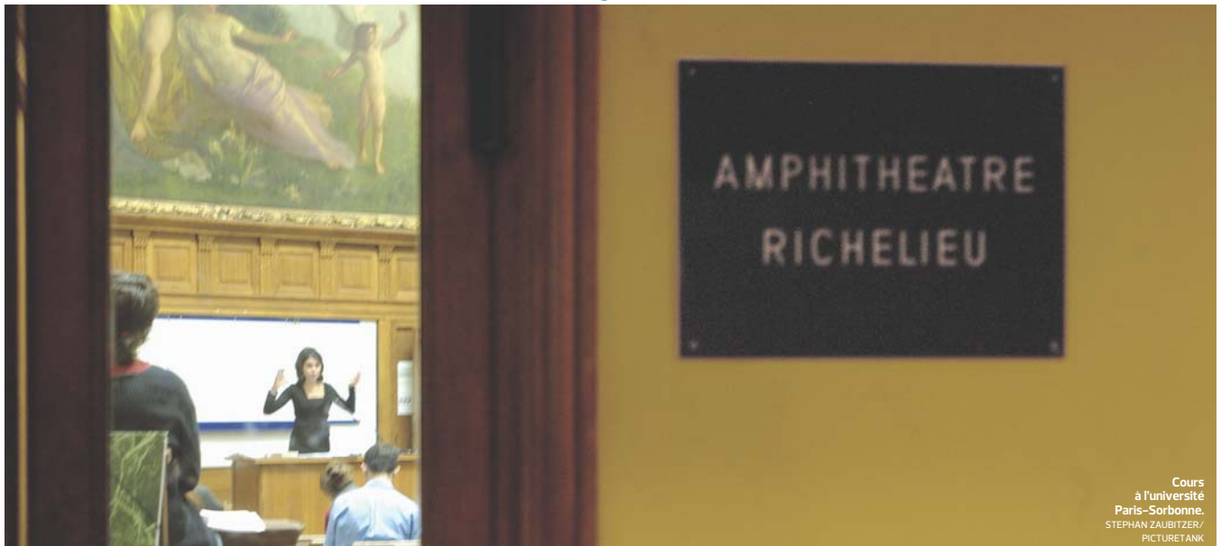
Cours à l'université Paris-Sorbonne